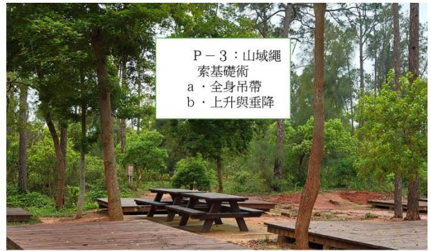
P-3：山城繩 索基礎術 a・全身吊帶 b・上升與重降