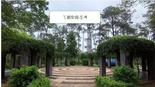
P-2: 快來幫助我(傷患搬運)