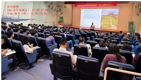
金內論壇 A組(高中高職生): 10:00-12:00 B組(國中小學): 13:30-15:30